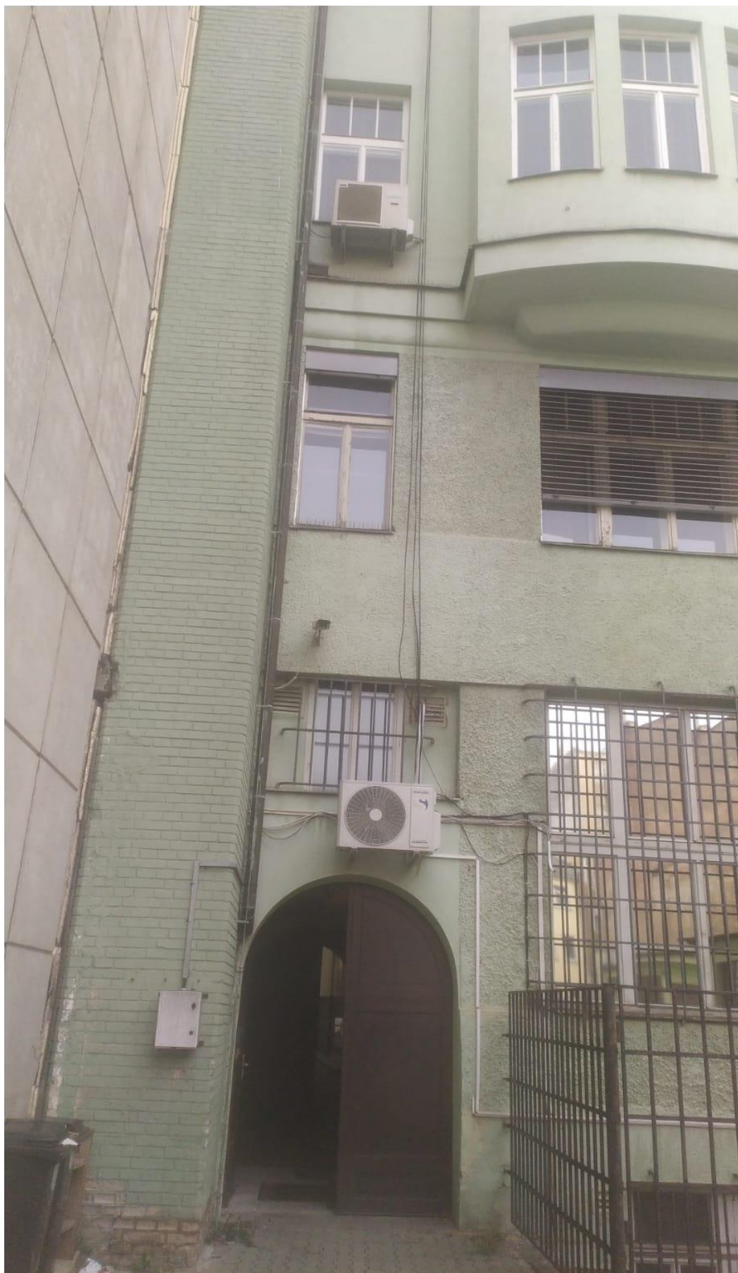
Venkovní jednotky 2.